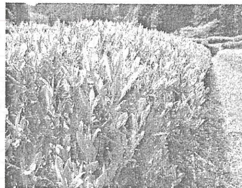
青々としたきれいな色です