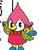
嬉野おおきん祭り マスコットキャラクター ウレッピー