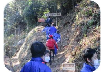
第1回 つながるころウォーキング