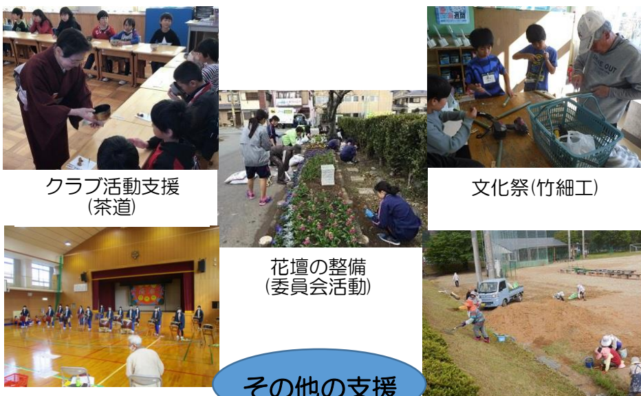
クラブ活動支援（茶道）

図書管理を電子化する学校では、作業量が膨大なため、ボランティアにたくさんお手伝いいただきました。