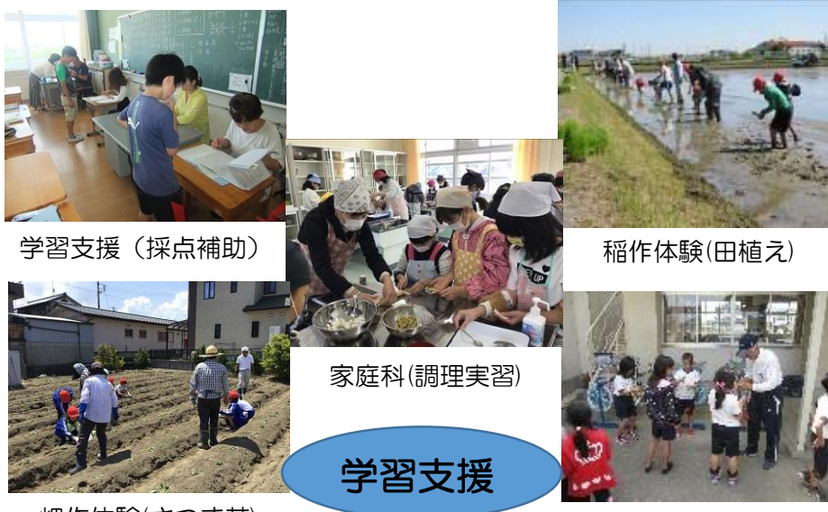
学習支援（採点補助）

ボランティアの方が、自分の都合の良い時間に、それぞれの方法で子どもたちを守るために活動していただいています。