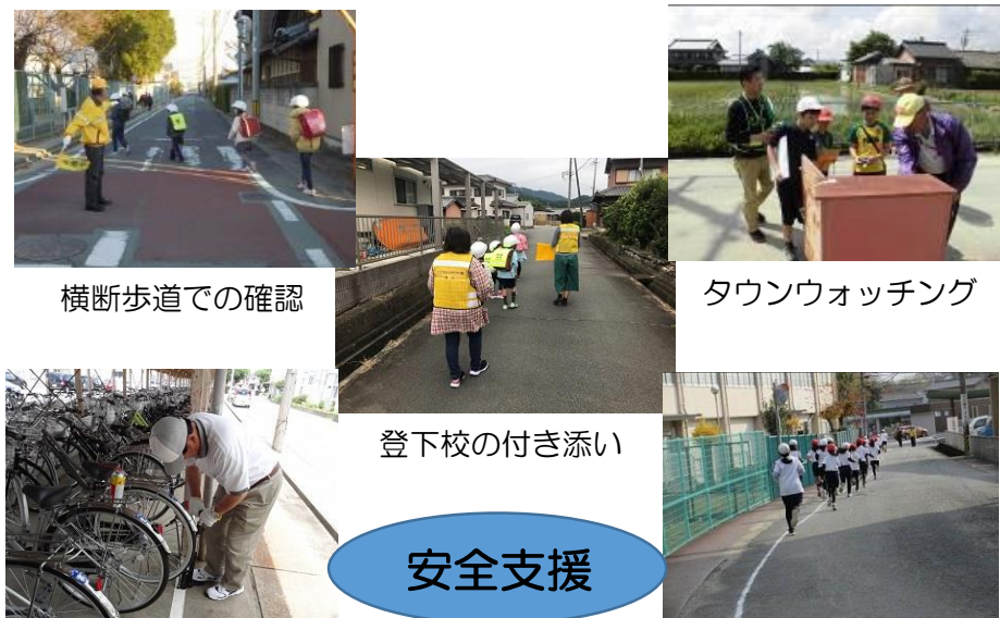
横断歩道での確認

さて、今年度は新型コロナウイルス感染拡大防止のため、どの学校においても例年どおりの活動がなかなかできにくくなっています。これまで当たり前のように子どもたちを支えていただいたことに改めて感謝しているところです。また、こんな今だからこそ、新たな支援の形に取り組んだといううれしいニュースも聞いているところです。今後とも子どもたちのために、ご支援・ご協力をよろしくお願いいたします。