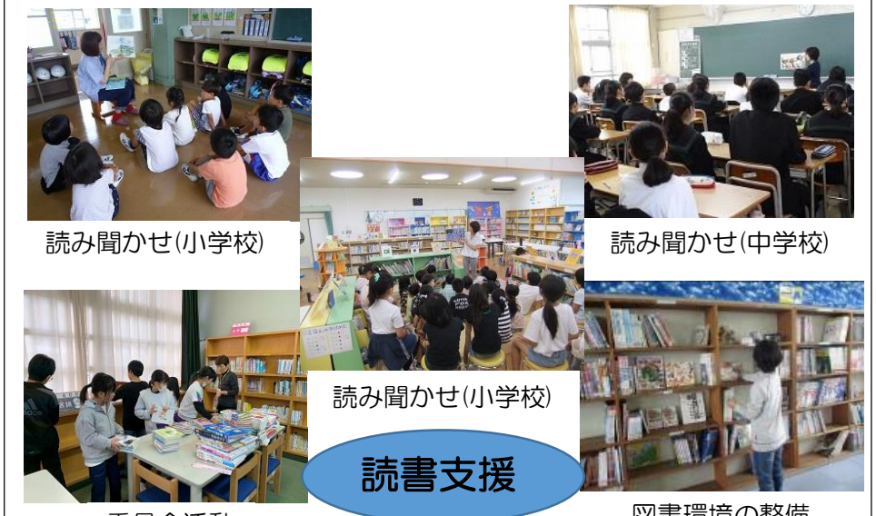
読み聞かせ（小学校）