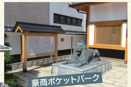
豪商ポケットパーク

原田二郎旧宅は、殿町同心町に残る江戸時代末期の武家屋敷です。この建物は、明治から大正にかけての実業家であり、公益財団法人原田積善会を設立した原田二郎の生まれ育った家です。(松阪市指定文化財)