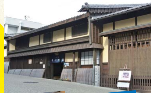
旧小津清左衛門家(松阪商人の館)

江戸で一番の紙問屋、小津清左衛門家の邸宅を公開。展示品の中には「千両箱」ならぬ「万両箱」もあり、「江戸店持ち松阪商人」の暮らしぶりが偲べれます。(三重県指定文化財)