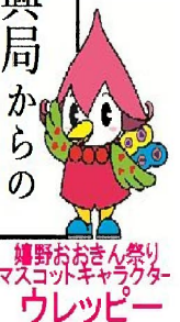
嬉野おきん祭り マスコットキャラクター ウレッピー