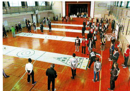
シャフルボード大会

大空の下「ふれあいウォーキング」年6回の「グラウンドゴルフ」森林浴を兼ねた「熊野古道散策」室内スポーツの「春/秋の体育祭」