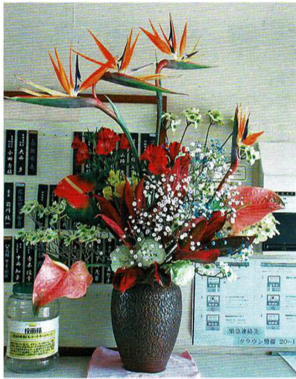
総会に準備の生花

地域の皆様に喜ばれ、たくさんの方に参加していただけるよう委員一同事業を実施してまいりますので、皆さん方のご理解ご支援をお願いします。