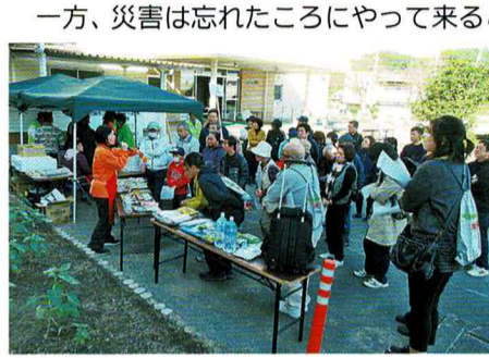
秋の合同防災訓練

一方、災害は忘れたころにやって来るといいます。阪神淡路大震災から25年、東日本大震災から9年が経過し、災害の記憶も薄れがちです。