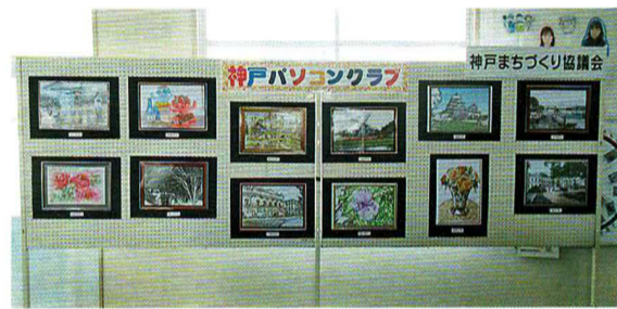
第五小文化祭で展示

本年度は、①広報の発行 ②広報の内容充実として、各部会や趣味クラブの取り組みや活動の様子、第五小学校や久保中学校の児童、生徒の活動の様子等を掲載、また、昨年始めた「神戸の花道」の継続 ③神戸MAPの作成へ情報収集とサンプル作成 ④第五小学校の文化祭でのまちづくりの活動紹介 という事業内容を予定しています。