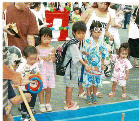
神戸地区夏まつり

今年度は、新型コロナウイルスの感染拡大防止のために、緊急事態宣言が発出され、数多くのイベントが延期や中止となっています。