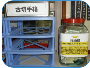
神戸地区市民センター