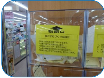
マックスバリュ学園前店

本年度になってますます還元額が減ってきています。重ねて地域の皆様のご協力をお願いします。 4月の還元額(9月～2月)は2,900円でした。 ◆合わせまして、神戸公民館では海外医療支援のため古切手も集めています。ご協力をお願いします。