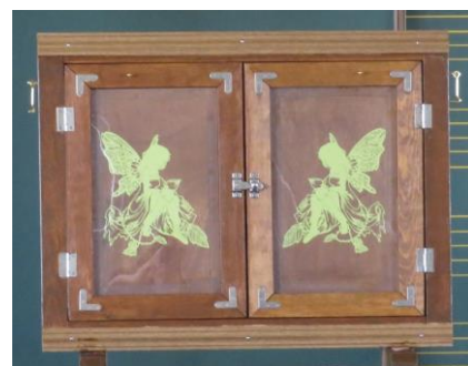
扉の装飾に素敵な切り絵をいただきました