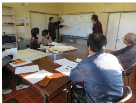
絵の構成を相談しています

また、高齢者への配食サービス、サロンドみなと、ふれあい農園など、地域で活動している他の事業についても紹介しました。