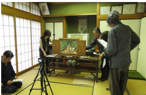
ビデオ撮影しながら特訓しています