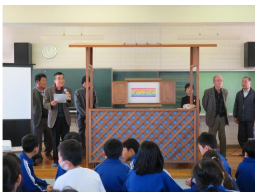
本番はアドリブも出て、みんな頑張りました！