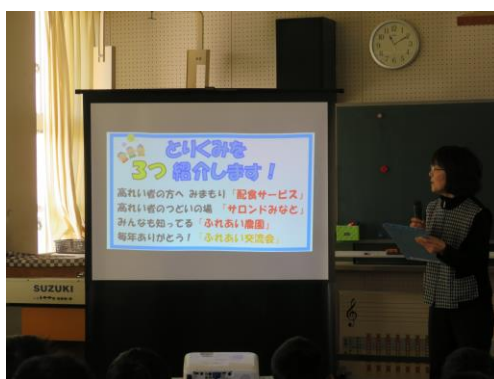
その他の活動についても知っていただきました