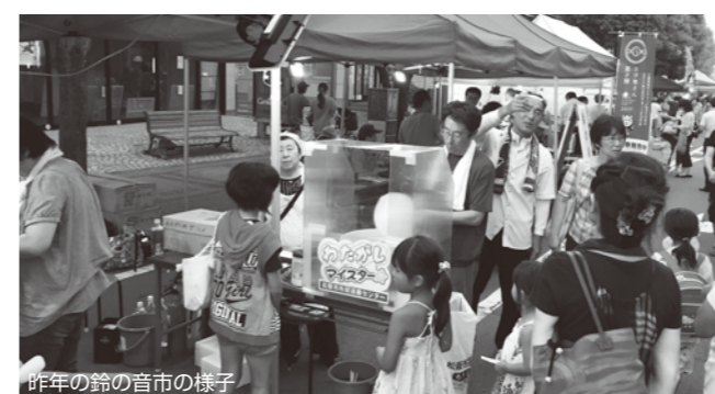
昨年の鈴の音市の様子

開催日程 鈴の音市 2017年 [会場] 松阪市中心市街地(阪内川~平生町・九天堂まで) 8月5日(土) 17:00~21:00 上記の時間、交通規制がかかります。