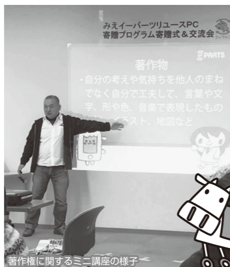
著作権に関するミニ講座の様子

2月4日、アスト津にて「みえ イーパーツ リユースPC寄贈プログラム」の寄贈式と交流会を開催しました。毎年好評のこのプログラムに当センターも参画して11年目を迎えます。今年度は県内のNPOに、ノート型、デスクトップ型のリユースPC合計50台を寄贈しました。そのうち松阪地域には、5団体、合計10台のリユースPCを寄贈しました。