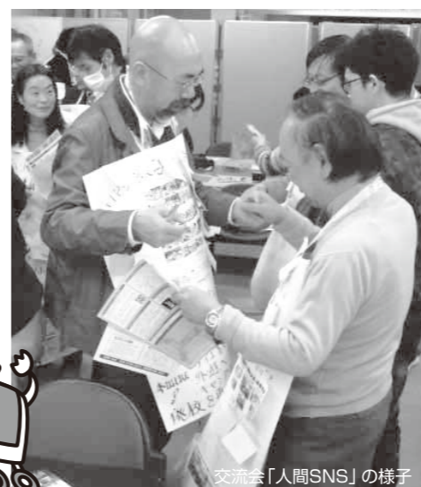
交流会「人間SNS」の様子

寄贈式では、インターネットセキュリティを“すごろく”で学ぶ「セキュろく」や、最近なにかと話題になる「著作権」にまつわるミニ講座も実施しました。特に著作権は情報発信にも関わるので参加者は熱心に耳を傾けていました。交流会では、SNS(ソーシャル・ネットワーキング・サービス)を、会場内の参加者同士対面で行う「人間SNS」を実施しました。団体名やPR文を書いた大きな紙を首から下げて互いにアピール。共感したらポストイットにコメントを書き込み「いいね」と互いに貼って交流しました。組織内部でのファイル共有や、情報の収集・発信など、PCはNPOの活動になくてはならない存在です。寄贈したリユースPCを活用していただくことで、この地域の市民活動が活発になることを願っています。