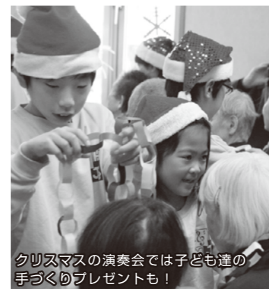
クリスマスの演奏会では子ども達の手づくりプレゼントも!

三重県南勢地区で唯一の小学生による金管バンド「松阪ハーモニックジュニアバンド」は、毎年この時期、福祉施設への慰問演奏や、定期演奏会の練習の真っただ中です。