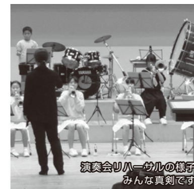
演奏会ハハ一丸の様子 みんな真剣です

慰問では、元気いっぱいの演奏がお年寄りを笑顔にしています。観客と距離が近いので、団員の子ども達も自分たちの演奏が人を喜ばせるのを実感できる良い機会となっています。