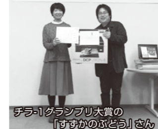
チラ-1グランプリ大賞の「すずかのぶどう」さん