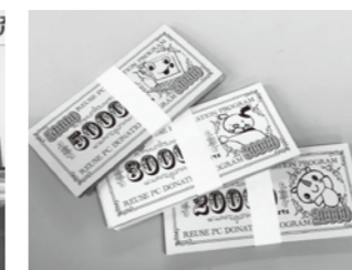
交流会で使った模擬紙幣 とういう小物にもカ入ってます!

この事業の一環として実施したのが「チラ-1グランプリ」です。三重県下のNPOから自作チラシを募り、Facebookでの一般人気投票と、県下の中間支援組織で構成された審査委員会で審査し、NPO自作チラシNo.1を決定する取り組みです。今年度の応募数は24作品。上位に選ばれた作品はどれもコンセプトや見せ方が明確で、情報が整理されていたのが印象的でした。