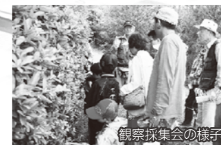
観察採集会の様子

活 動当初は身近な家のまわりから始めたクモ探し。40年という活動を通して県内の隅々まで足を伸ばして調査を行った。その活動の中で実は新種のクモまで発見している同会。会誌の名前にもなっている「しのびぐも」がそれだ。1965年にメンバーの一人が津市美