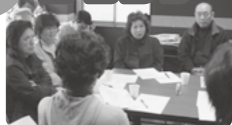
会議での活発な意見交換から新しい企画が生まれます

このお店は、来店者や出店団体の意見を大切にしながら、共に作り上げています。「商品販売を通じて市民活動団体がお客様と交流できることがこの店のいいところ」という嬉しいご意見を多数いただいています。そこで、出店する楽しさを知ってもらえて、気軽に参加できるアピールショップの新企画。それが「フリマスペース」です。●●●●●▶