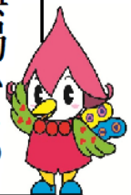
嬉野おおきん祭り マスコットキャラクター ウレッピー