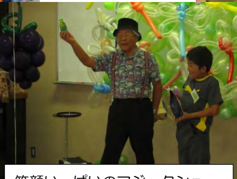
笑顔いっぱいのマジックショー