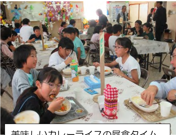
美味しいカレーライスの昼食タイム