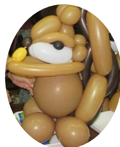
黒田町自治会での交流