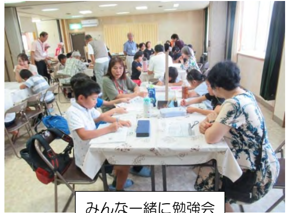
みんな一緒に勉強会