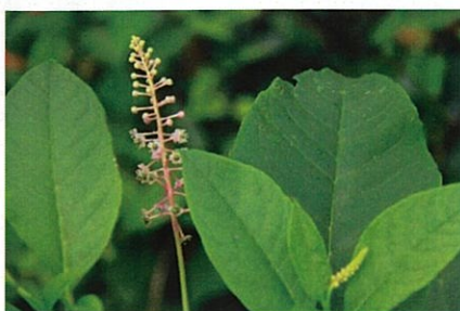
ヨウシュヤマゴボウ

北アメリカ原産の帰化植物。高さは2m前後に達し、秋になると紅葉する。熟した果実は柔らかく、つぶすと赤紫色の果汁が出る。