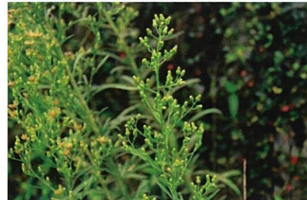
ヒメムカシヨモギ

草丈は60~100cmになる。花は3~4mmと小さく、ピンク色に色づく。花期は7~9月。衣服などによくくっついてくる。