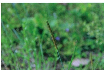
スズメノテッポウ

畑の雑草であるが、道端や荒地にも生育。夏期、枝先に黄色の小さな花を咲かせる。同属に松葉ボタンなどが知られる。