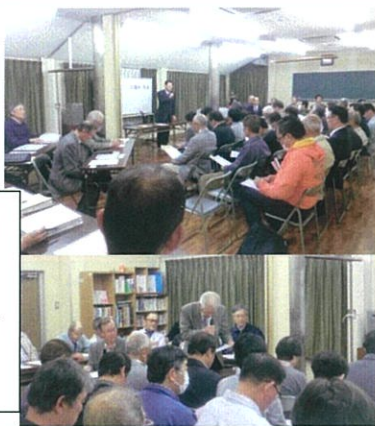
4月21日 まちづくり協議会 総会