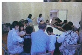
5月23日保育園児との交流会