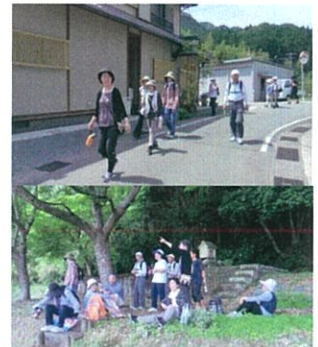
丹生大師ウォーキング

本地区では数年前から「毎日続けようラジオ体操」「もつと歩こう」「グラウンドゴルフをしよう」などを取り組んできました。適度な運動習慣は、生活習慣病や認知症予防と改善に効果があり健康寿命を延ばすためにも体が動かす習慣を身につける事が大切です。 今年度も、ウォーキング、グラウンドゴルフ大会、市民体育祭、ボウリング大会など