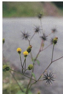
アメリカセンダングサ

イネ科の1年生の雑草。 夏から秋にかけて付ける 花穂が犬の尾に似ている ことから犬っころ草(いぬ っころくさ)が転じてエノ コログサという名になっ た。