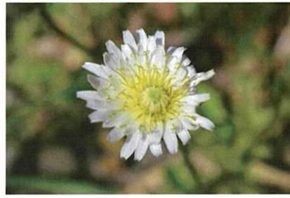
シロバナタンポポ 日本在来種。2～5月にかけて白い花をつける。