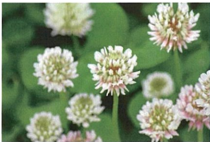
シロツメグサ 茎は地上をはい、葉は3小葉からなる。花は葉の柄よりやや長い花茎の先につく。