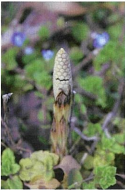
ツクシ スギナの 胞子茎(ほうしけい) 漢字の土筆は土に さした筆の姿から