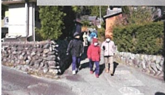
ウォーキングする参加者の皆様