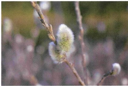
ネコヤナギ 早春に川辺で穂が出る姿は美しい。春を告げる植物。