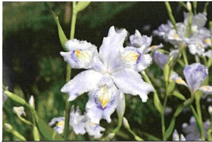
シャガ かなり古く日本に入ってきた帰化植物。中国原産