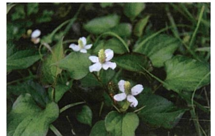
ドクダミ 住宅周辺や道端に自生し、反日陰を好む。花期は5～7月