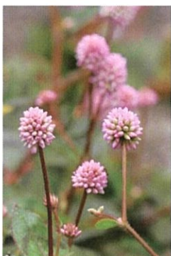
ヒメツルソバ タデ科の植物 ヒマラヤ原産 日本には明治時代に導入