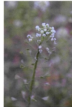
ナズナ アブラナ科の越年草。別名ペンペングサ、シャミセングサ。花期は2～6月