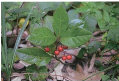
ヤブコウジ(十両) 花期は5～6月で、5～6mmの小さな花を咲かせる。