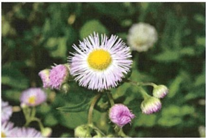
ハルジオン 帰化植物。ヒメジョオンとともに道端でよくみられる。