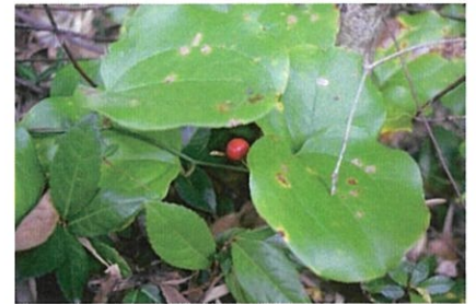
サルトリイバラ 草丈 75～350cm。茎にとげが生える。葉は柏餅を包むのに用いる。