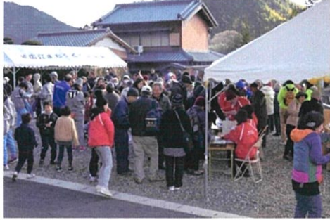
受付をする参加者の皆様