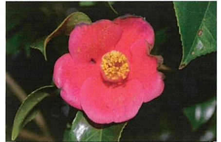
ツバキ(椿) 常緑樹。花期は冬から春にかけて。