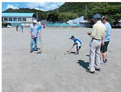
大人も子供も楽しみました。