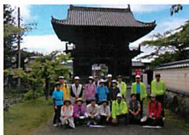
雨も上がりさわやかなウォーキングとなりました。