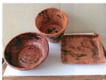
竹かごに和紙を張り、柿渋を塗ります。