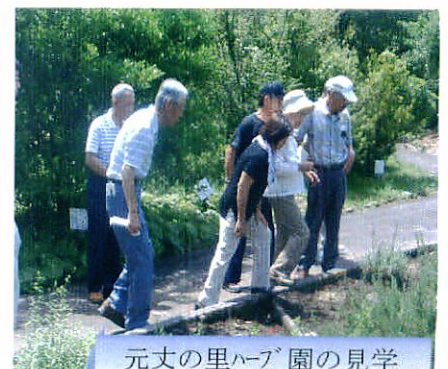
元丈の里ハーブ園の見学

健康食推進員の方につくっていただいた「ハーブクッキー」と一緒に楽しんでいただきました。