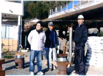
竈（かまど）を使った炊き出し

皆様のご協力に感謝いたしますとともに、ご意見ご要望がございましたら部会までお願いいたします。