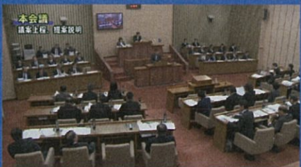
松阪市議会 本会議