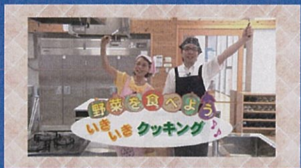
いきいき健康情報