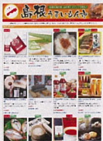
他地域でのWEB物産展 開催イメージ

約1億人以上の顧客基盤を有する楽天市場上に松阪市のWEB物産展を企画・開催します。売上拡大のきっかけに活用してみませんか？(12月の1カ月間予定)