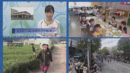
アイウエーブまつさか