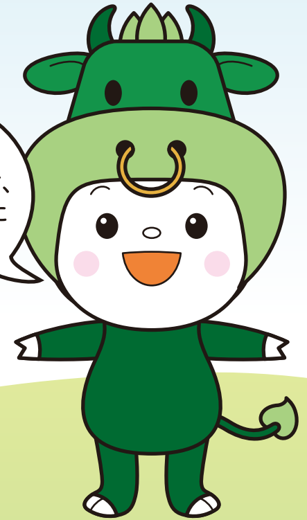
松阪市マスコットキャラクター ちやちやも