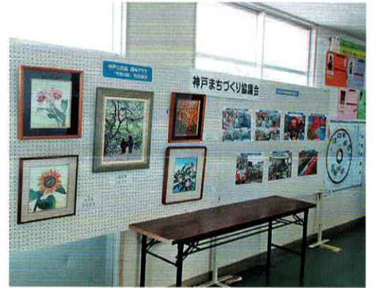
第五小文化祭でのちぎり絵とパネル展

本年度は、①広報の発行、②広報の内容充実として、各部会の取り組みや活動の様子、第五小学校や久保中学校の児童、生徒の活動の様子等を掲載、また、昨年始めた「神戸の花道の継続」③神戸MAPの作成へ情報収集④第五小学校の文化祭でのまちづくりの活動紹介という事業内容を予定しています。