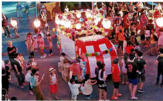
神戸地区夏まつり

このほかにも多くの公民館事業を計画していますので、たくさんの方の参加をお待ちしております。