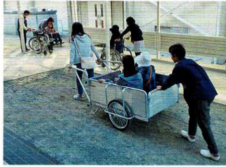
秋の合同防災訓練

一方、空き巣などの被害も後を絶ちません。また、高齢者を狙った詐欺事件も多発しています。地域の防犯力を高め、犯罪を未然に防ぐためにも、地域のつながりを強めることが有効です。日ごろから声を掛け合い、顔と顔の見える関係を築き、何かあったら気軽に周囲に相談できるようにしておくことが大切です。今年もまちづくり協議会の活動に積極的な参加とご協力をお願いします。