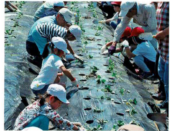
子ども農園 芋の苗植え