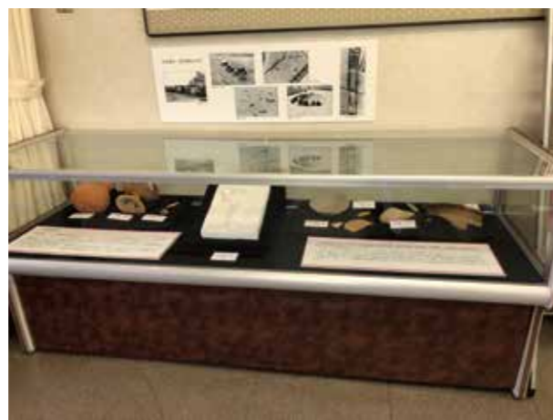
文化財センター ロビー展示