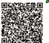
バーコード読み取り (文化財センター情報)

その5 ★キッズミュージアムトーク 8/25(日)10:00～11:00 * 事前申込不要