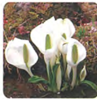
水芭蕉(波瀬植物園)