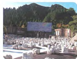
陶芸空間・虹の泉