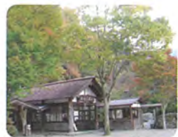
波瀬植物園・おふく茶屋