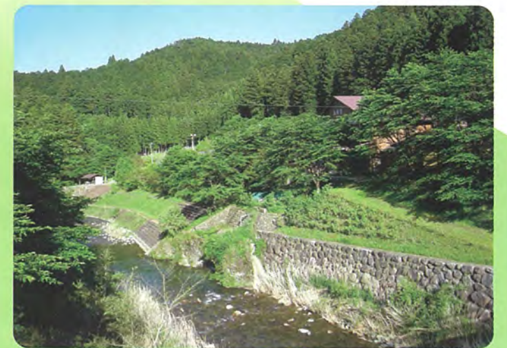
グリーンライフ山林舎