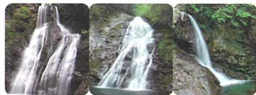
木梶三滝 白滝・女滝・不動滝