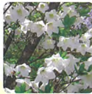
シロヤシオ(三峰山)