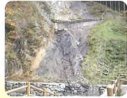
月出の中央構造線