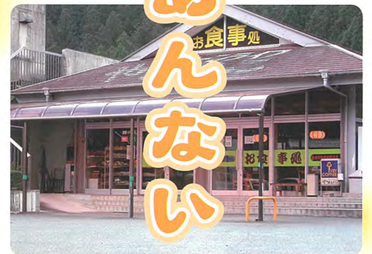
グリーンライフやまびこ