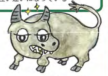
わたしが理想の牛です

ヤマトヒメの学習コーナー 牛は天神さんのお使い よい牛の条件とは?? ☆角は天に向かい ☆目は地をにらみ ☆首が鹿のように滑(なめ)らかで ☆耳が小さく ☆歯が互い違いになっている