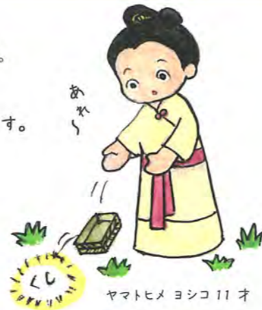
ヤマトヒメ ヨシコ11オ