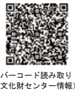
バーコード読み取り (文化財センター情報)

【イベント】 第3G ■ワークショップ「勾玉づくり」 3/3(土)、3/4(日) 10:00～12:30 (受付は12:00まで) ※材料費(1セット)100円 はにわ館ロビー ■ハンドベル ミニコンサート 3/18(日) 10:00～、10:30～、11:00～ ※小学生によるハンドベルのミニコンサートです。