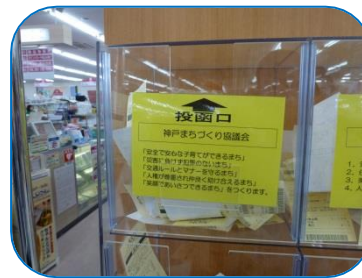
マックスバリュ学園前店

◆毎月11日、マックスバリューで買い物をしますと黄色いレシートが発行されます。このレシートを神戸まちづくり協議会のBOXへ投函していただきますと、金額の1%を希望する商品で還元していただけます。 神戸まちづくり協議会のBOXは、マックスバリュ学園前店と神戸地区市民センターに設置しています。皆様のご協力をお願いします