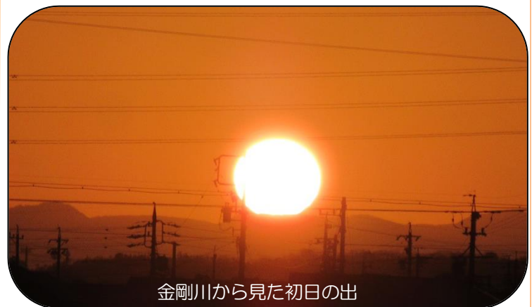
金剛川から見た初日の出