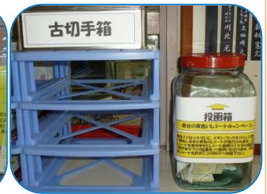
神戸地区市民センター