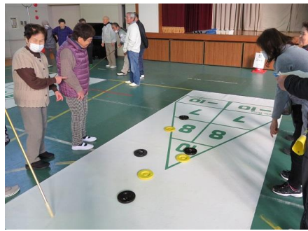
シャフルボード 得点は何点になるかな…？