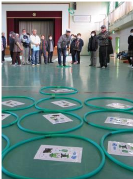
C.C.リング 輪っか目がけて投げます！