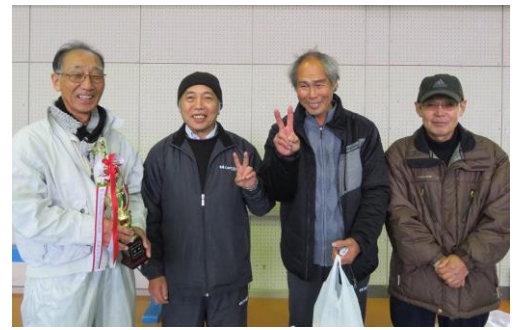
優勝の西栄東中町チーム2連覇！おめでとうございます！

上位チームの皆さんには、2月11日（日）開催の北ブロック公民館スポーツ大会に、港公民館代表として出場いただくことになっていますので、よろしくお願いたします。