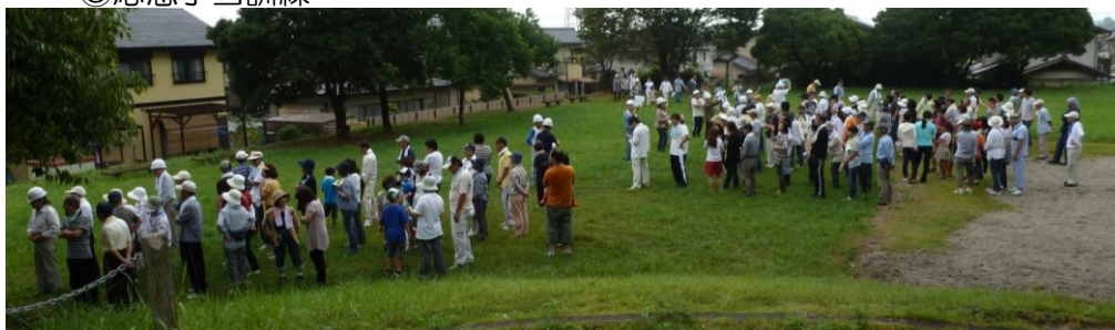
参加者230名の安否確認