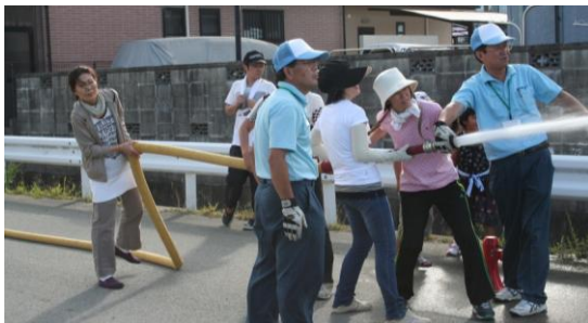
女性消防隊による放水訓練