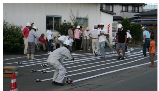
消防ホースの巻取訓練