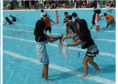
ウナギつかみを楽しむ子ども達