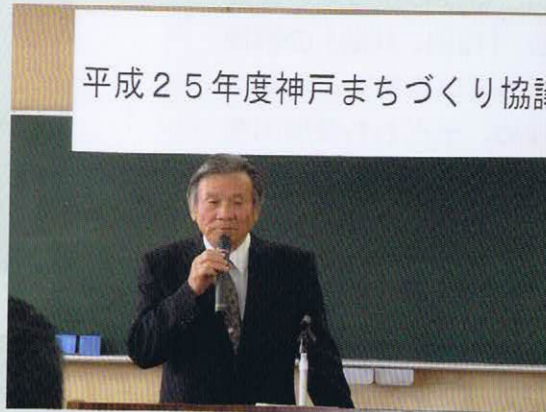
平成25年度神戸まちづくり協議

神戸自治連合会を中心にして神戸地区内で活動していた様々な団体の代表者によって「神戸まちづくり協議会」が平成24年2月21日に設立されてから2年目を迎えました。