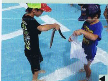
◀ うなぎつかみ大会

その他各種教室や講座も予定しております。たくさん皆様の参加をお待ちしております。