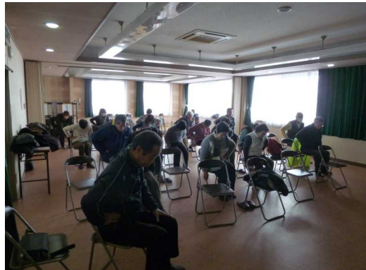
椅子に座ったままでできる太極拳の体験