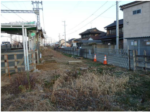
大津町方面への出入り口工事（1月14日）

◆昨年の12月21日より近鉄東松阪駅を無人化するとの申し入れに対し、協議会では、松阪高校・三重高校と連名で「東松阪駅の無人化に反対する要望書」を提出しましたが、近鉄の無人化の方針は変わらず実施されました。このことから、実施前の12月16日、17日と実施後の1月14日の7:30～8:00の間の状況を確認したところ、暫定期間で駅員の方もおられ、大津町方面への出入り口の工事も始まっていましたが、心配していたような変化は現在のところ全くありませんでした。