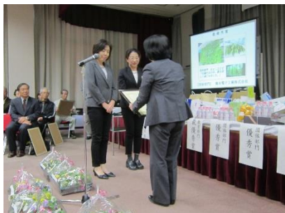
団体部門 最優秀賞 橋本電子工業株式会社