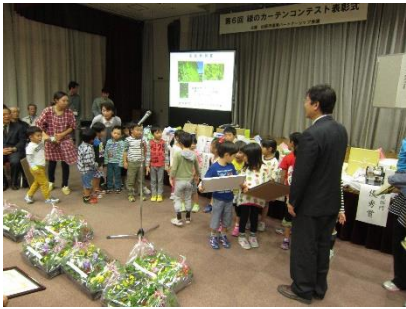
市長特別賞 教育部門 若草保育園