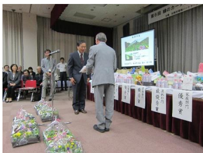
松阪農業協同組合より副賞贈呈