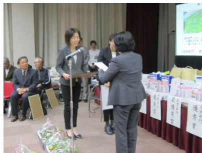
株式会社ぎゅーとらより副賞贈呈