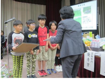
教育部門 最優秀賞 小野江小学校