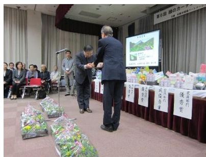
マックスバリュ中部株式会社より副賞贈呈