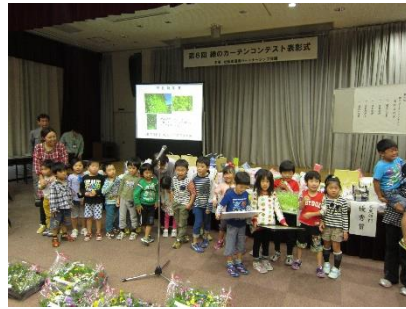
松阪市より副賞贈呈