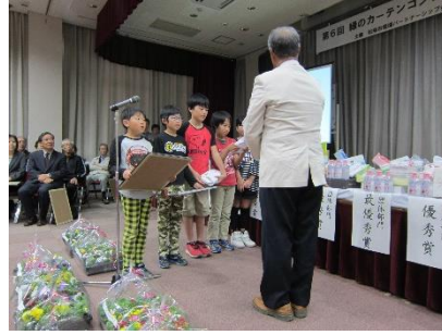
セントラル硝子株式会社松阪工場より副賞贈呈