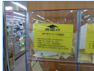
マックスバリュ学園前店

◆合わせまして、神戸公民館では海外医療支援のため古切手も集めています。ご協力をお願いします。