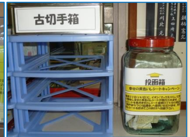
神戸地区市民センター