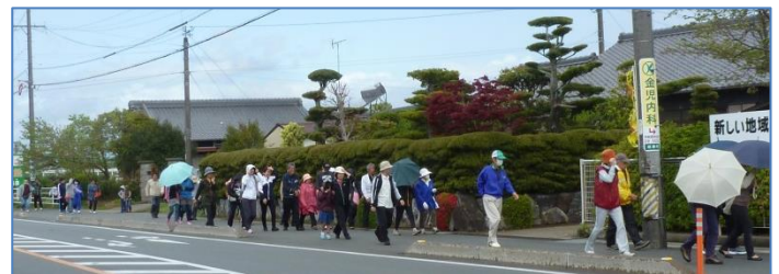
出発して10分足らずで引き返しました