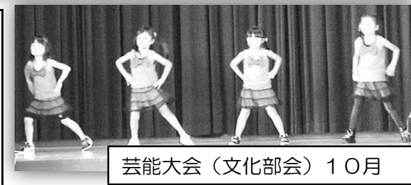
芸能大会(文化部会) 10月