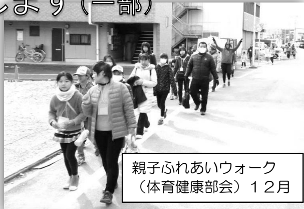
親子ふれあいウォーク (体育健康部会) 12月