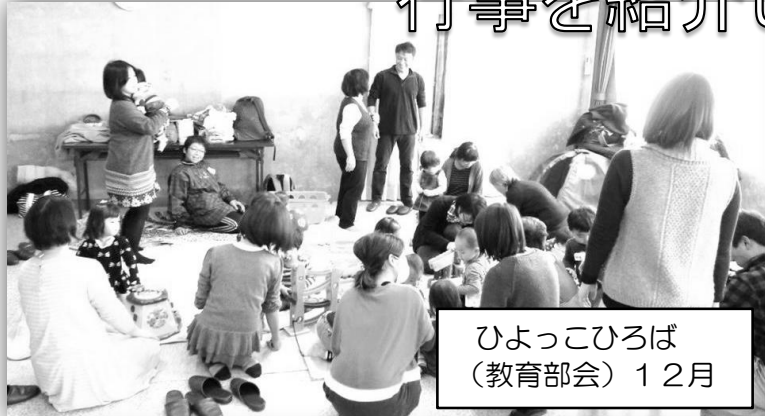
ひよっこひろば (教育部会) 12月