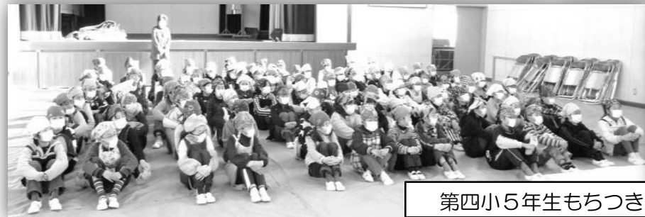
第四小5年生もちつき支援(教育部会) 12月