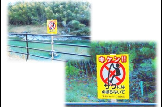
宮前まちづくり協議会観光部会