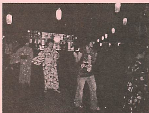
祭文踊りと扇踊り、新祭文踊りが繰り広げられました

祭りの最後に、花火と抽選会が行われ、今年の祭りが無事終了。皆さんありがとうございました。