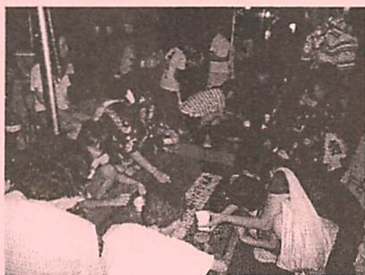
バザーの前は大勢の人でにぎわっていました