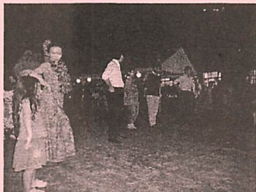
アロハー みんなもいっしょにフラダンス