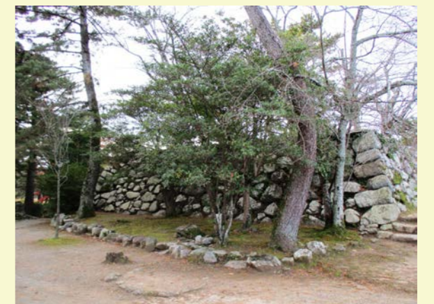
石垣をさえぎる樹木