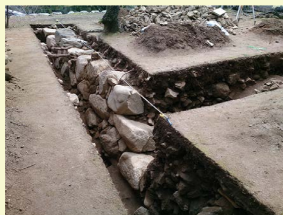
発掘調査でみつかった石垣