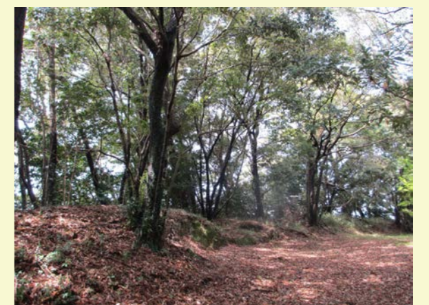
土塁上で巨大化する樹木