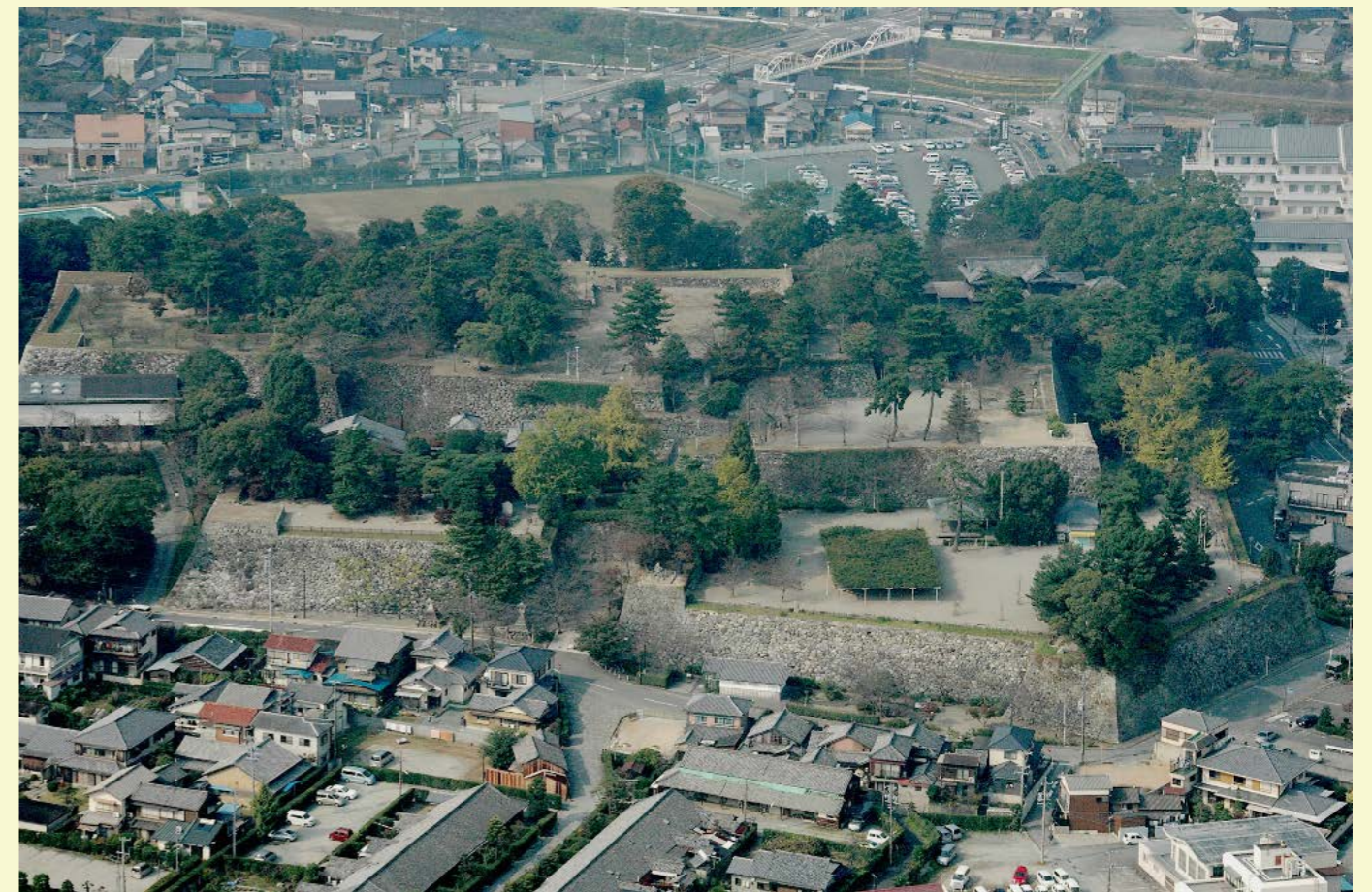
現在の松坂城跡の姿

表門付近②の樹木はスダジイが主で、グラウンド側②はスギが主です。いずれも松坂城跡の魅力のひとつである石垣が引き立つような効果を期待しています。