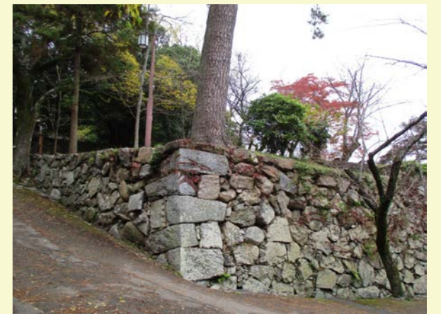
根で石を押し出している樹木