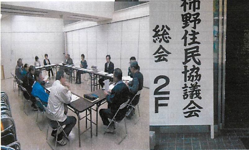
総会の打合せ役員会議

住民協議会が飯南体育振興会、飯南虹クラフへ補助金を出し今日までの活動に一層拍車をかける事になりました。更に今年度から、柿野住民協議会のスローガン「夢のある柿野、住んでいて楽しい柿野」いつまでも住みたい柿野」を目指した、「地域計画」(町のイメージ)の策定に着手していく事になりました。今号の住民協議会たよりは、主に総会に提出した資料を基に発行致しました。 推進委員さん(七十七名)を中心として会員皆様と共に町づくりに取り組んでいきます。今後ともよろしく願います。