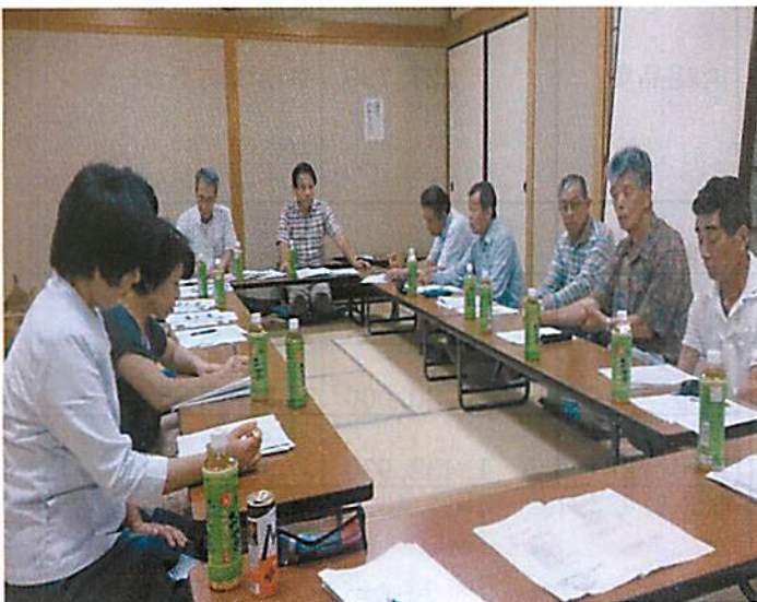
(六月二十七日開催の策定委員会議)

製本になった地域計画書は、地域皆様 にご覧になって頂くことを考えていま すが、今後策定委員会で検討・協議してま いります。