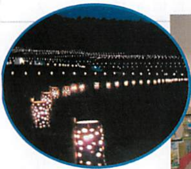
光の列に酔いしれる竹行燈