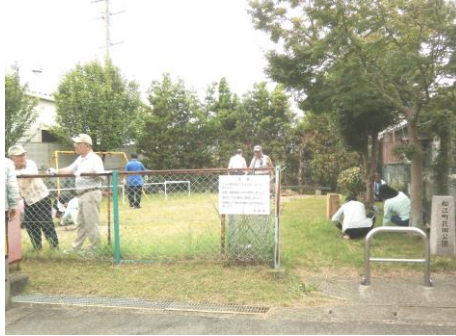
船江町団地北自治会