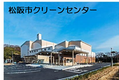
松阪市クリーンセンター

持ち込める物は、三雲管内で「拠点回収」で集めている資源物と「プラスチック容器・袋」