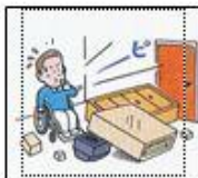
家具等が倒れてくる