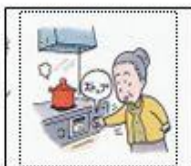
揺れが終わってから火を消す