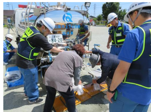
持参したペットボトルに給水して持ち帰りました。