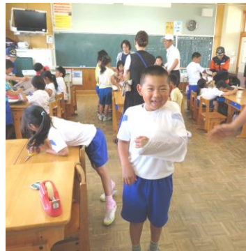
応急処置として、ごみ袋で三角巾！