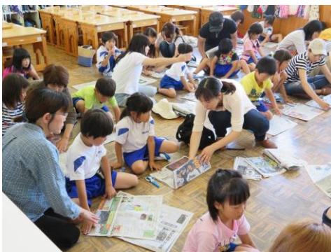
新聞紙でスリッパが簡単に作れました。