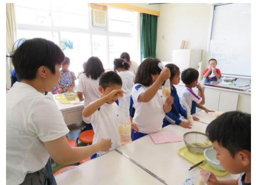
ポリ袋にお米と水を入れてご飯を炊きました。