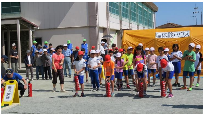
水を入れた消火器で、初期消火を体験しました。

港消防団の皆さん、自治会の皆さん、当日の準備及び運営にご尽力いただきありがとうございました。港まちづくり協議会は、今後も防災への意識を地域の皆さんに持ってもらうよう、継続した取り組みを行い、安心して安全な港地区のまちづくりを目指します。