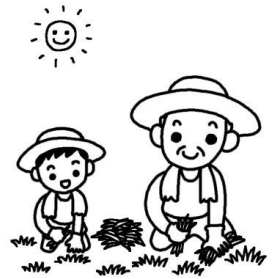
狹師地区自治連合会