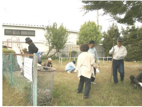
船江町団地北自治会