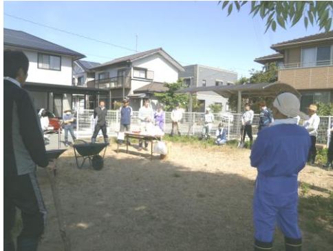
新小寄団地自治会