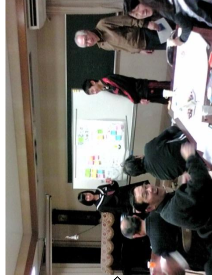
第4回・中学生の発表