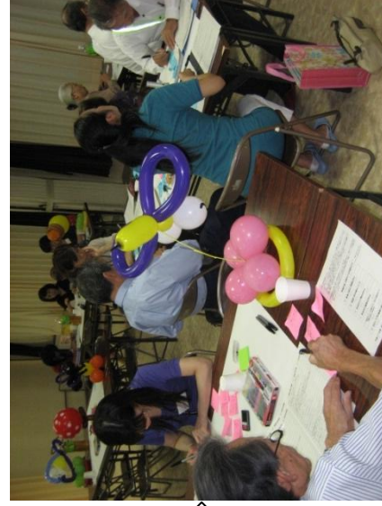
気楽に話し合える サロン形式の会議