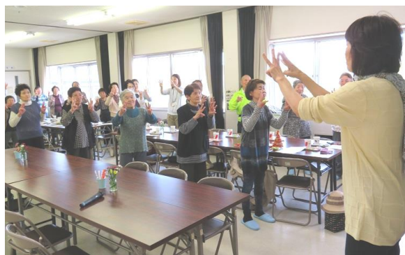
にわたりの体操で盛り上がりました!