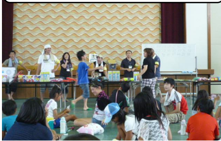
◎ビンゴゲーム大会◎