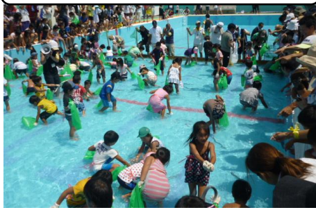
◎うなぎつかみ(こどもの部) ◎